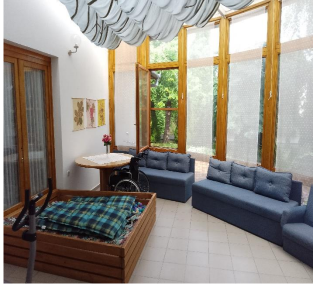
Támogatott lakhatás (folyosó, pihenő)