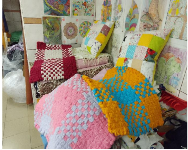
Késztermékek (korongozott dísz tárgyak, mohácsi népi kerámiák, párnák, szőnyegek)