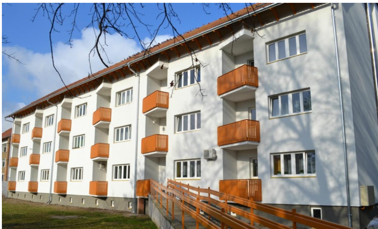
Mohács-Kölked Református Társegyházközség Pándy Kálmán Otthona