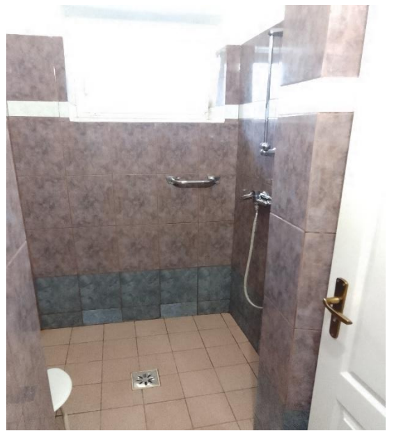
Fürdőszoba, wc, zuhanyzó