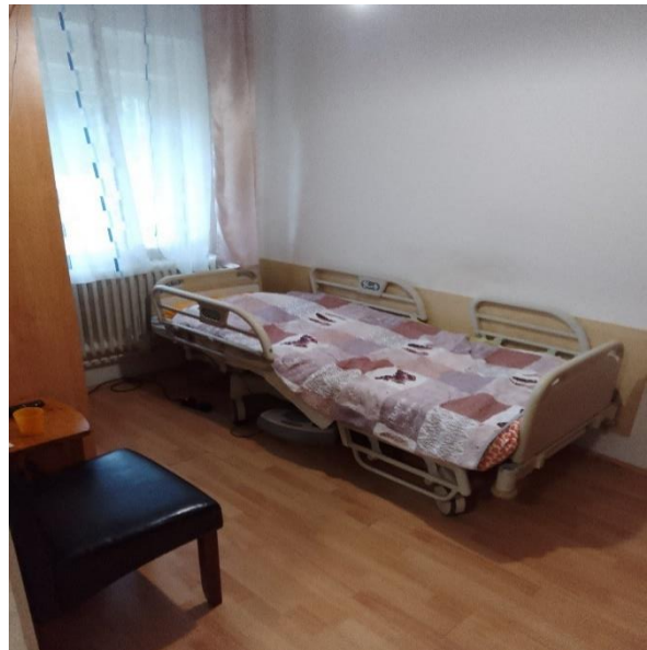
Lakószobák az ápoló- gondozó otthonban (3 ágyas, 1 ágyas elkülönítő)