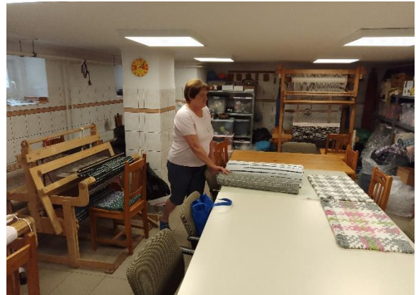
Foglalkoztató műhelyek (kerámiaműhely, szőnyeggyártó műhely)