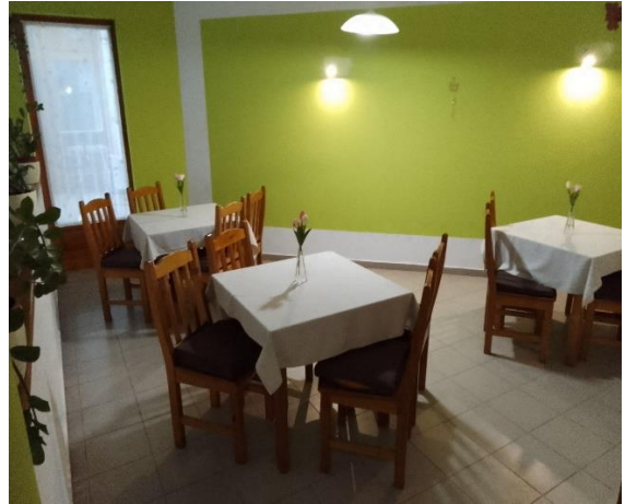
Támogatott lakhatás (nappali, étkező)