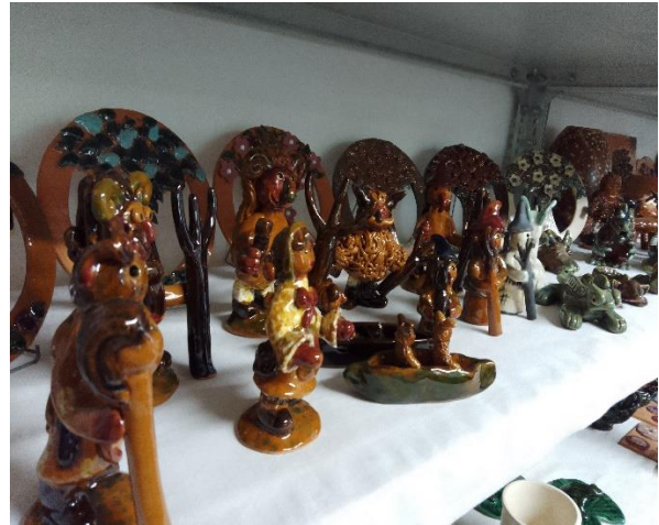
Késztermékek (kerámia ékszerek, ajándéktárgyak)