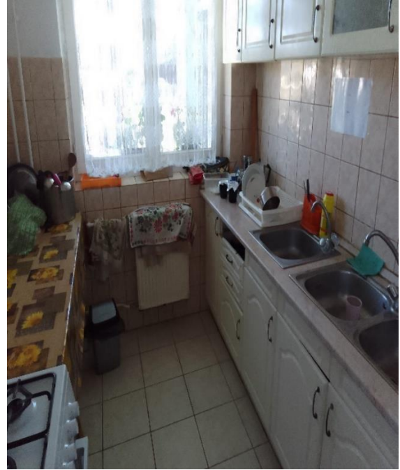
Lakóotthon (fürdőszoba, konyha)