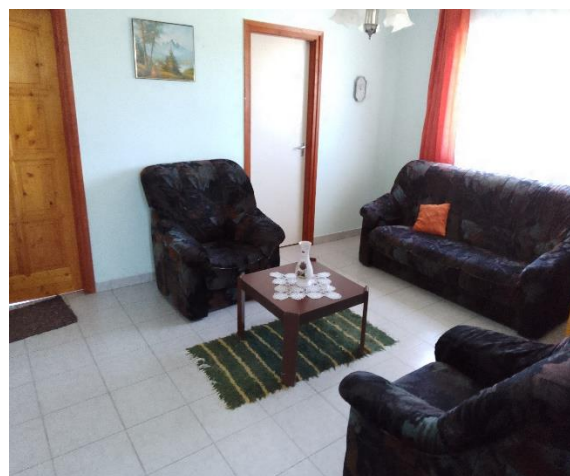
Lakóotthon (nappali, közösségi tér)