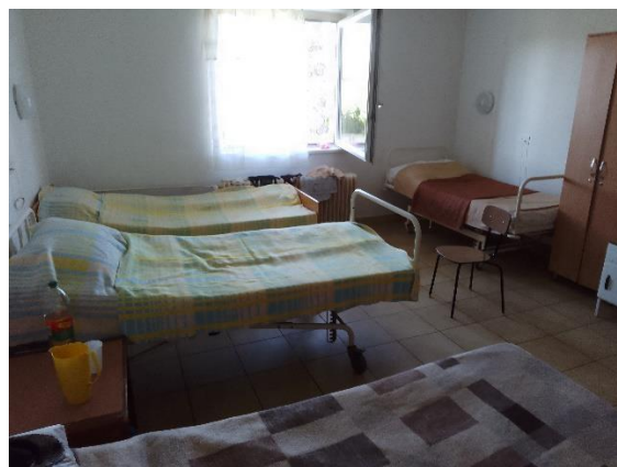
4 ágyas lakószobák