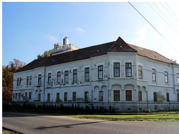
Rózsakert Integrált Szociális Intézmény (kastély épület)