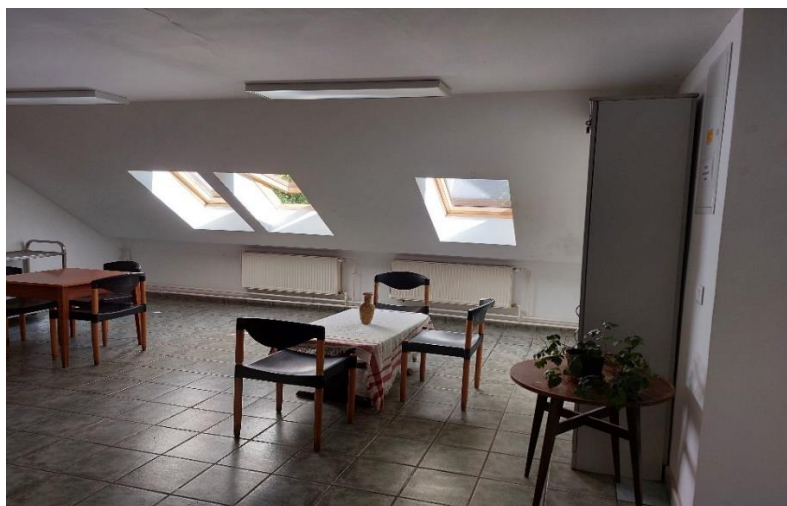
Pavilon felső szint (társalgó)