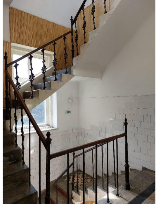
Oldal bejárat, lépcsőfeljáró