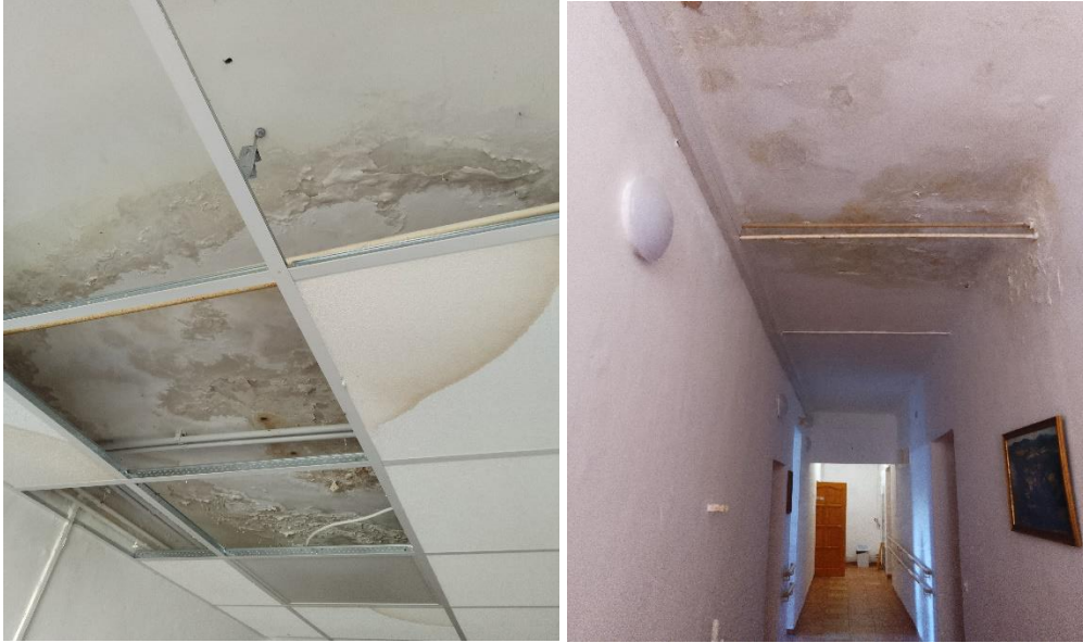
A beázás jelei a folyosók mennyezetén