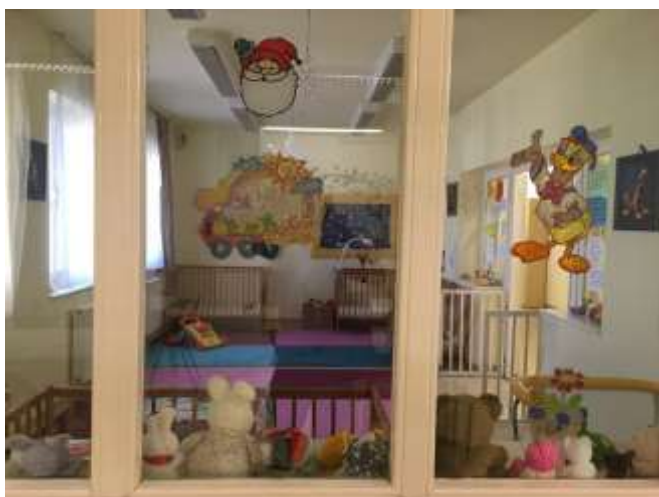
I/3. Közös helyiség a II. Objektum anya-gyermek részlegén