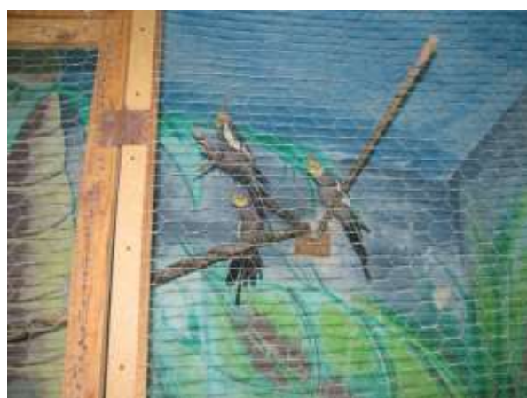
I/6. Terápiás állatok a fiatalokú férfiak körletén