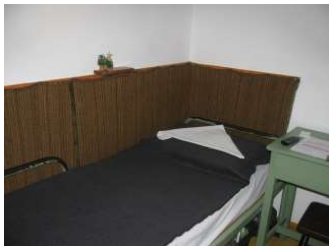
I/2. Lakóhelyiség a II. Objektumban – „B-C” körlet