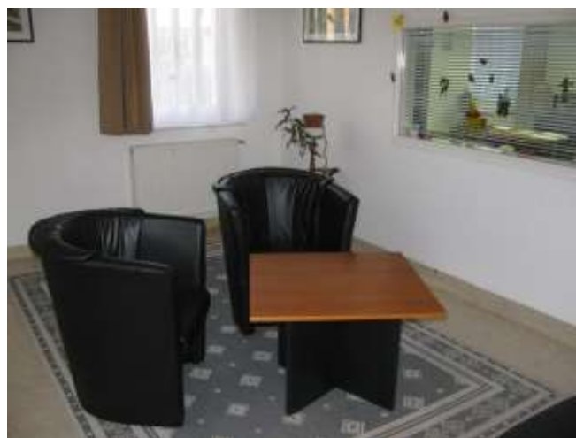
I/4. A gyermekláthatás lebonyolítására szolgáló helyiség a II. Objektum anya-gyermek részlegén