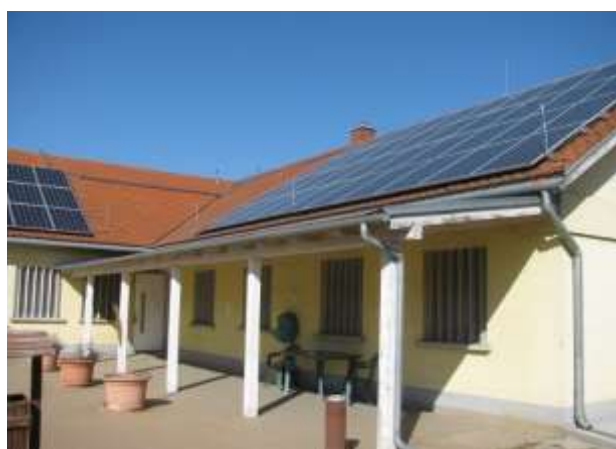
I/5. Fedett rész a II. Objektum udvarán