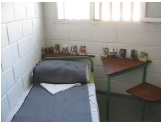
I/1. Zárka a II. Objektumban – fiatalokú férfiak körlete