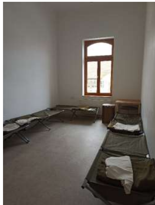
5. a és b kép: A menekülők elhelyezésére szolgáló régi kastélyépület és a kialakított fekhelyek