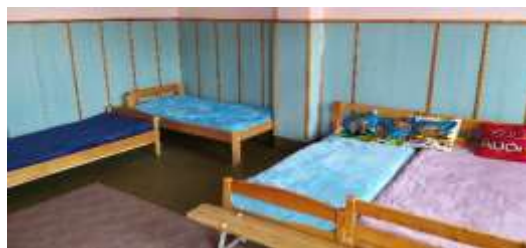
1. a és b kép: Sokágyas szobák a Mándoki Otthonban