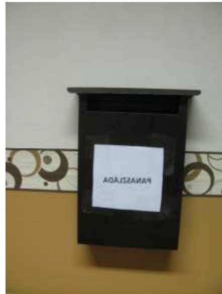
4. a és b kép: Panaszláda a Mándoki és a Fülöpösdaróci Otthonban