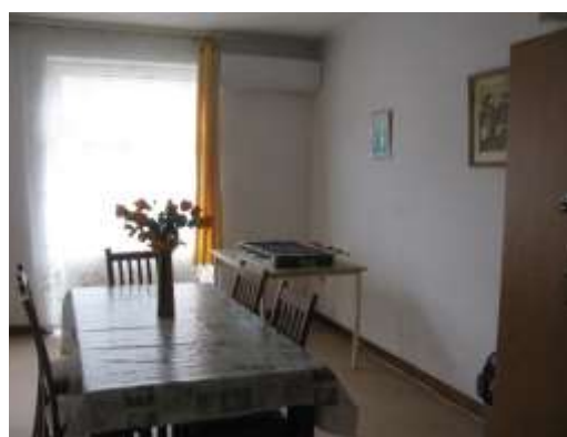
3. a és b kép: Foglalkoztató a Mándoki Otthonban a gyermekek, és a Fülöpösdaróci Otthonban az idősek számára