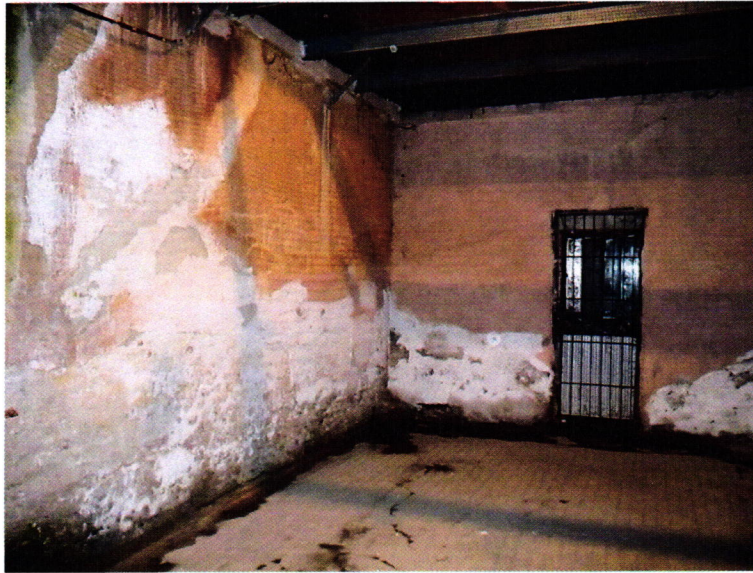
1. kép: a Fogda sétaudvara