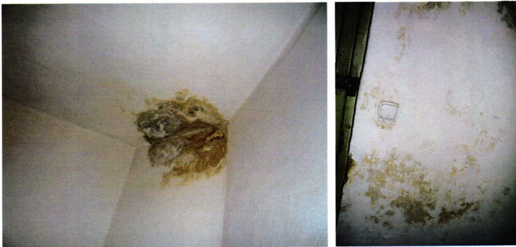
6-7. kép: beázás, penész nyoma a Fogdán