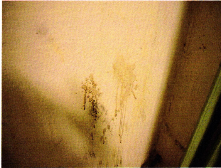
8. kép: szennyeződés a Fogda zárkájának falán