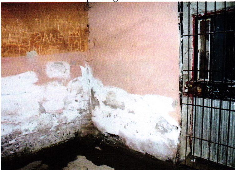
3. kép: a Fogda sétaudvara