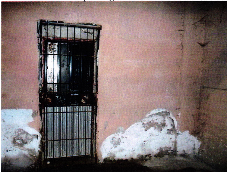
2. kép: a Fogda sétaudvara