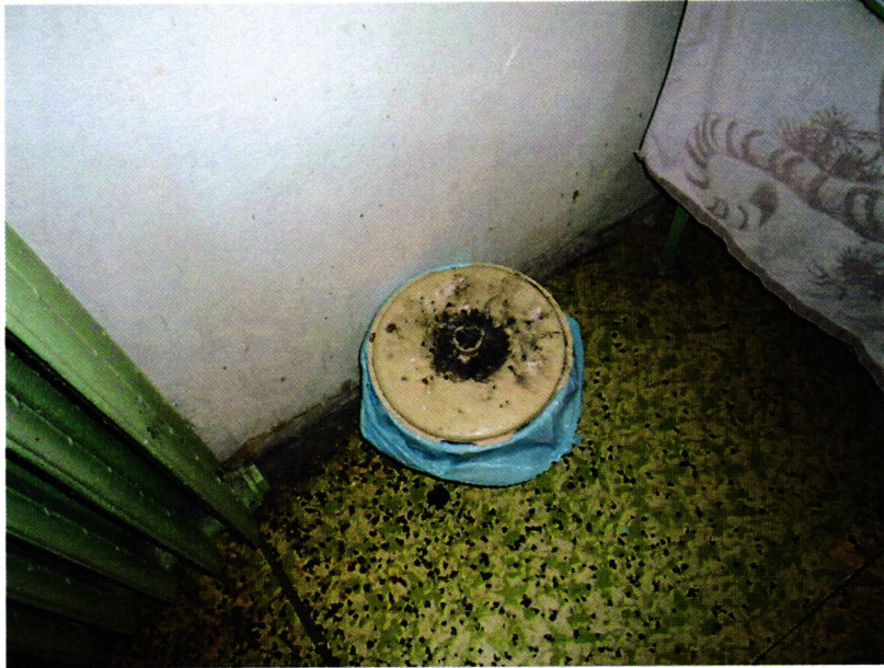
10. kép: a szemetes teteje a hamutartó