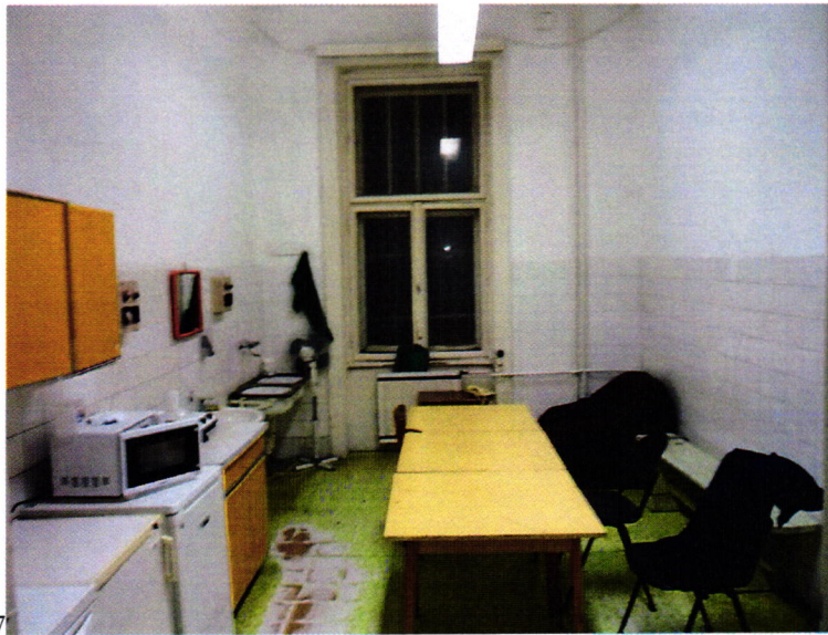
13. kép: az őri pihenő-konyha