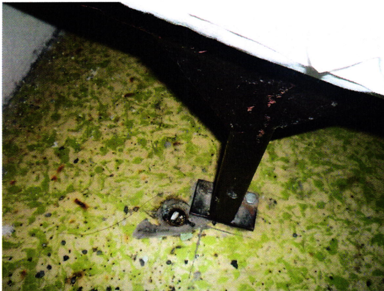
9. kép: sérült linóleum padló a Fogdán