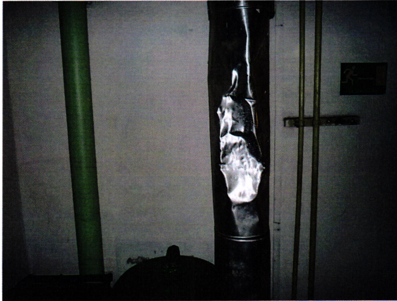
12. kép: horpadások a fűtéscsövön