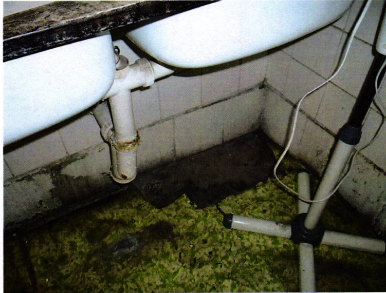
15. kép: hiányos, rossz állapotú padló az őri pihenőben