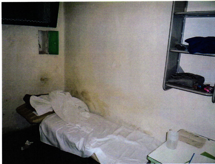
5. kép: zárka a Fogdán