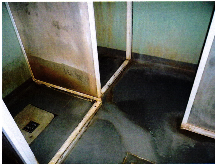
16. kép: az őri zuhanyzó leromlott állapotban