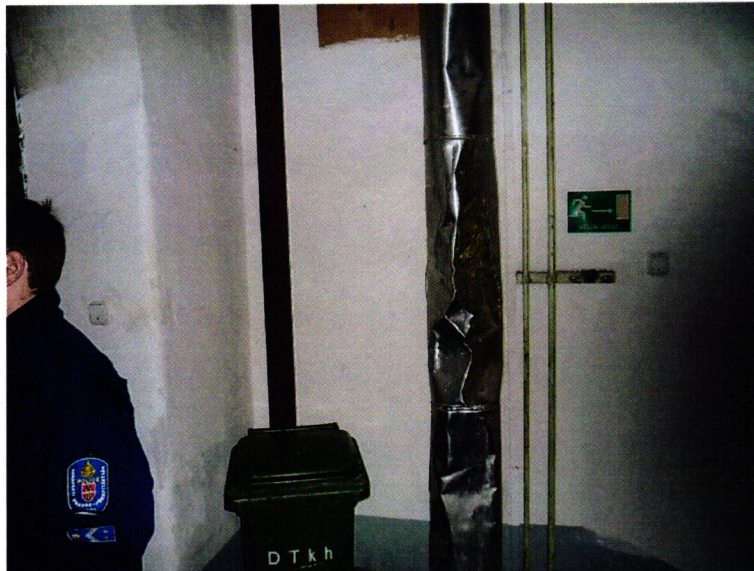
11. kép: horpadások a fűtéscsövön