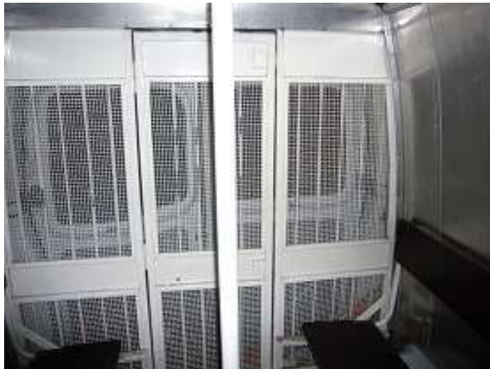
Fogvatartotti üléstér – zárkarész - kapaszkodóval, biztonsági öv nélkül a szállító járműben (9)