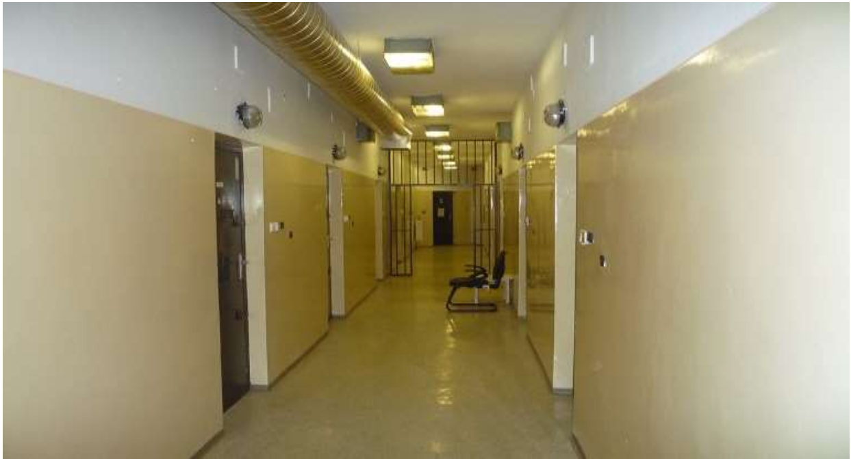
Fejér Megyei Rendőr-főkapitányság Központi Fogdájának folyosója (1)