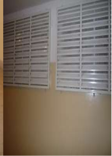
Szabadlevegőn tartózkodásra kijelölt sétáló helyiség és a szellőzést jelentő rácsos nyitott ablakok (5)-(6)