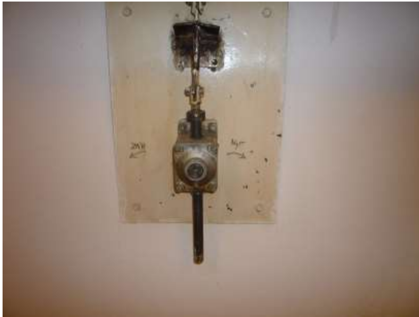
A zárkákban látható ablaknyitó szerkezet (3)