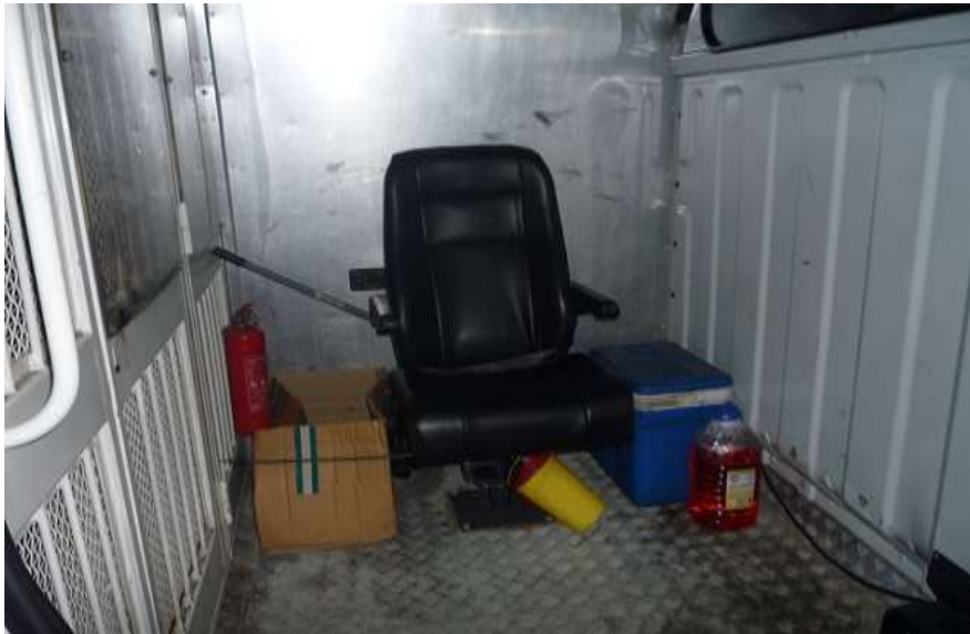
Az őrszemélyzet részére kialakított – biztonsági övel felszerelt - fotelszerű ülés a szállító járműben (8)