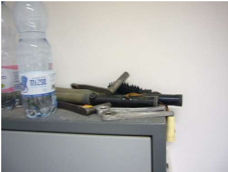
A szolgálati pihenő-étkezőben a kapcsolószekrény tetején tárolt ablaknyitó pedálkarok és a használaton kívüli gumibotok (2)