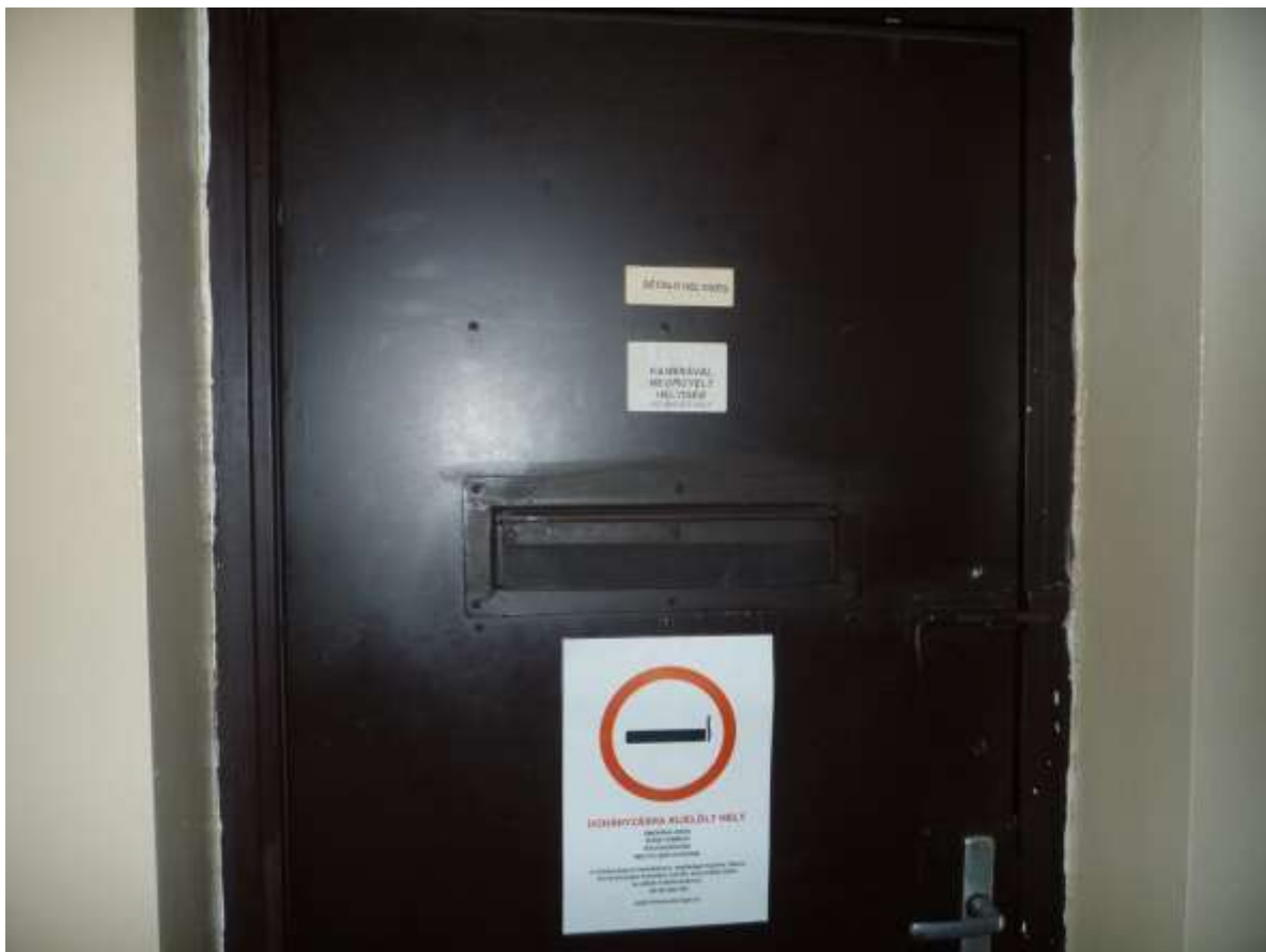
Szabadlevegőn tartózkodásra kijelölt sétáló helyiség bejárata és lent maga a helyiség illetve a szellőzést jelentő rácsos nyitott ablakok (4)