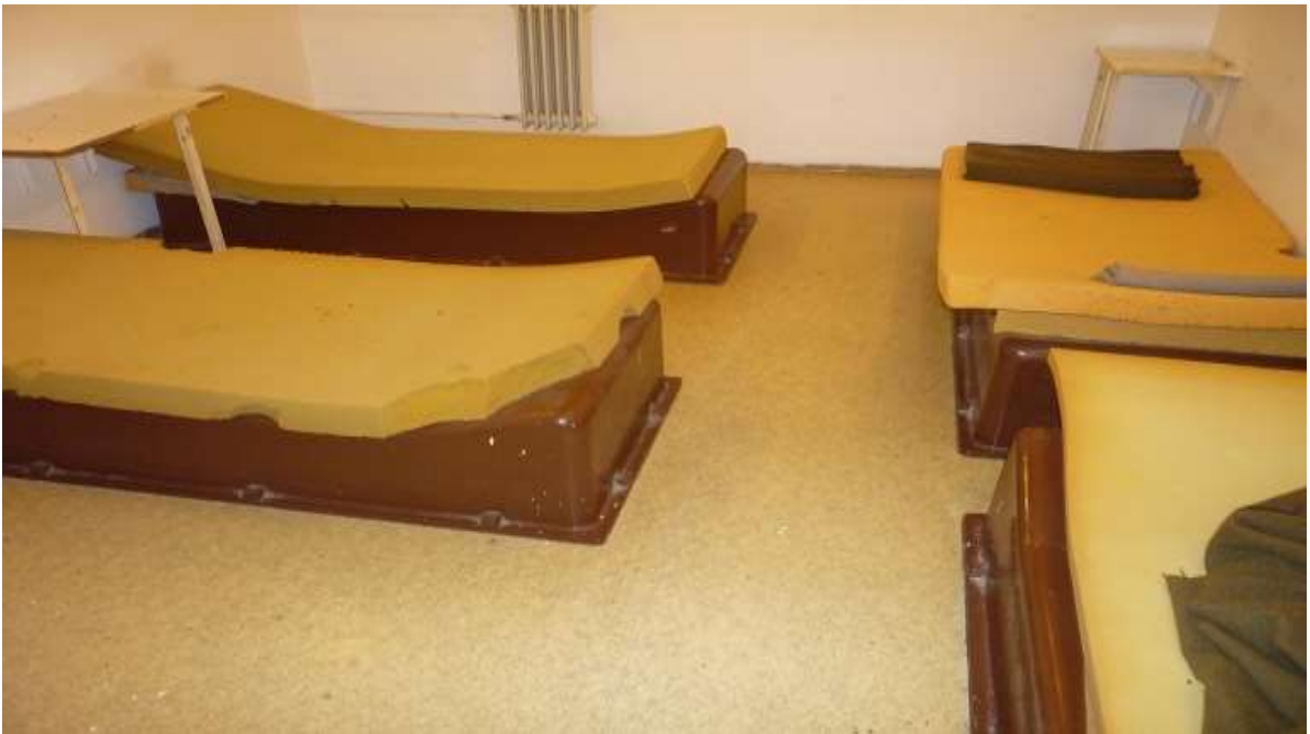
Zárkákban látható műanyag ágytest és szivacsbetétek (7)