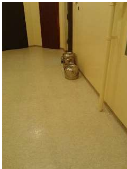
Ételszállító badellák a Fogda folyósón (10)