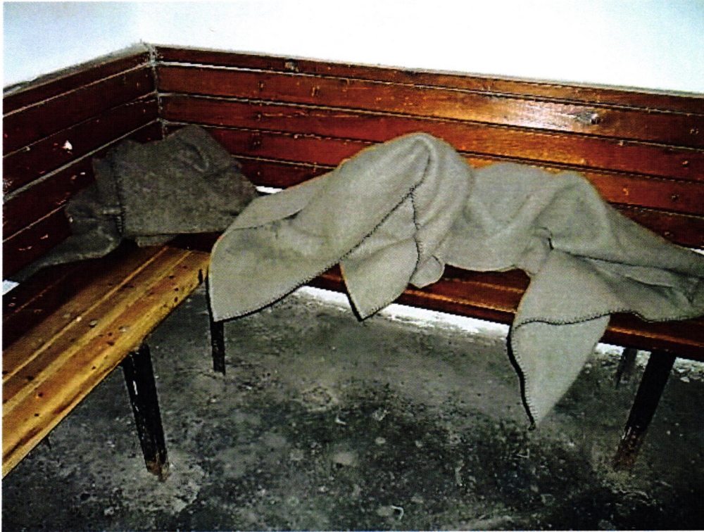
3. kép: Előállító helyiség paddal és takarókkal