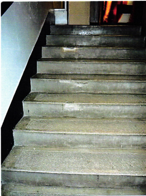
7. kép: Balesetveszélyes lépcső