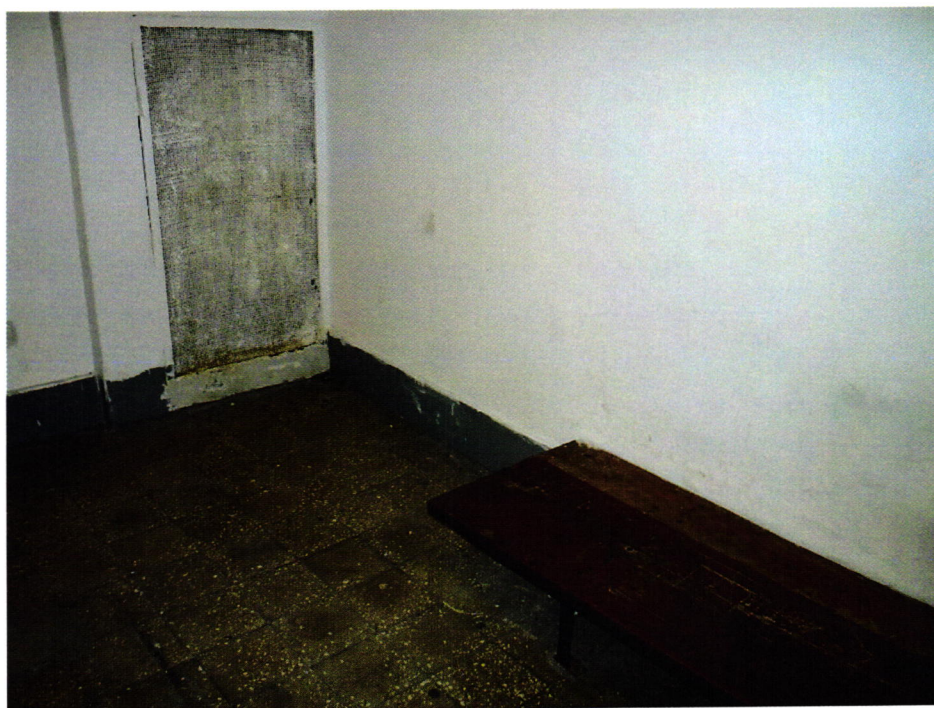
2. kép: Előállító helyiség belülről