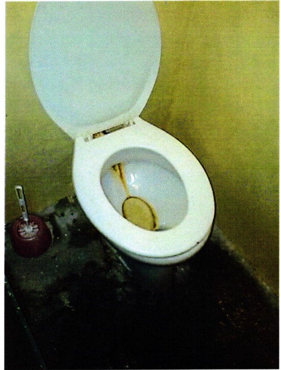
6. kép: Fogvatartotti illemhely