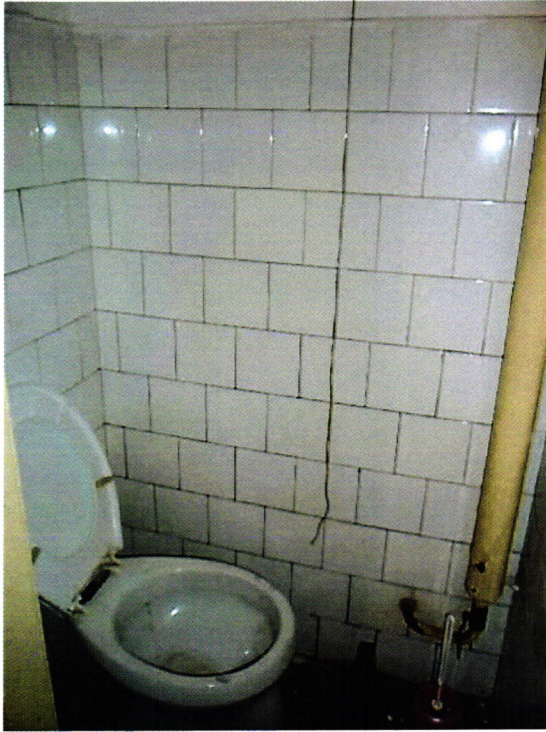
5. kép: Személyzeti illemhely