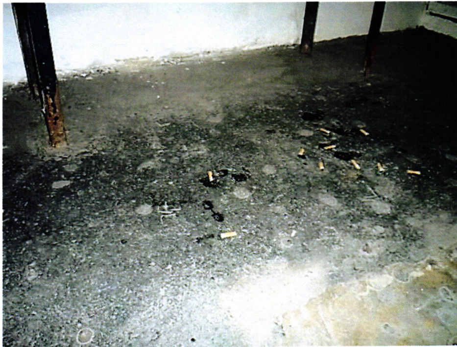
4. kép: Cigarettszikkák az előállító helyiség padlóján