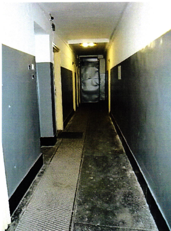
1. kép: Az előállító egység folyosója