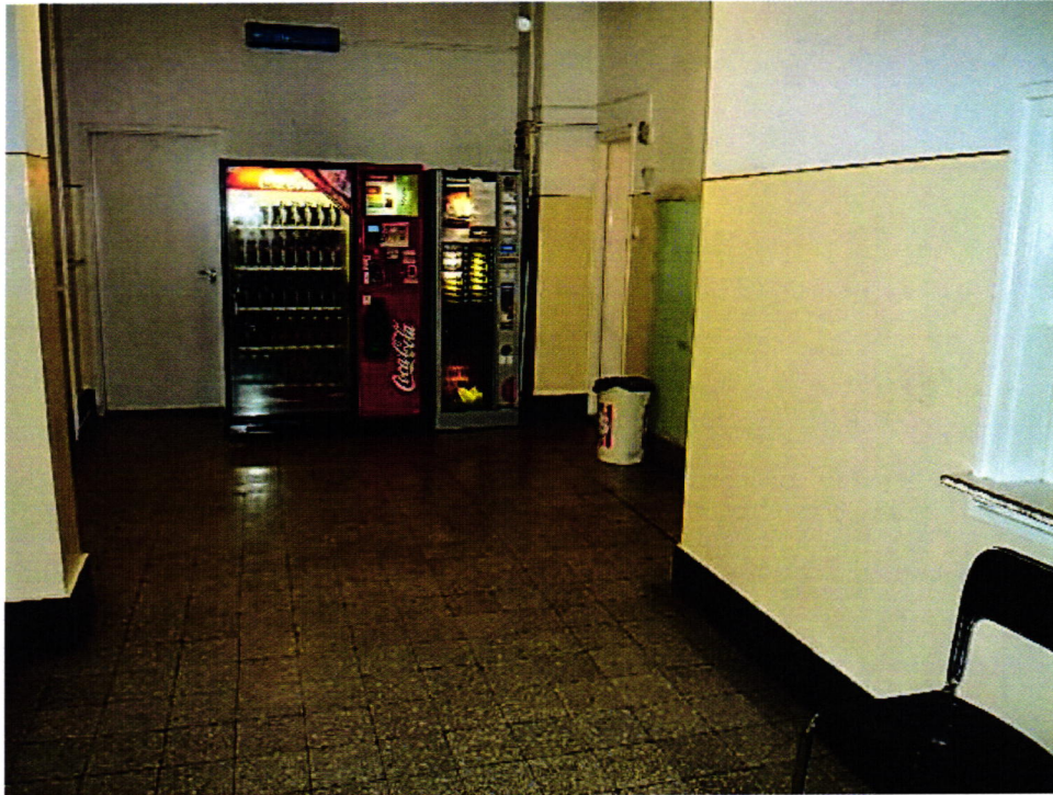
9. kép: Az előállítottak ezen a folyosón várakozhatnak