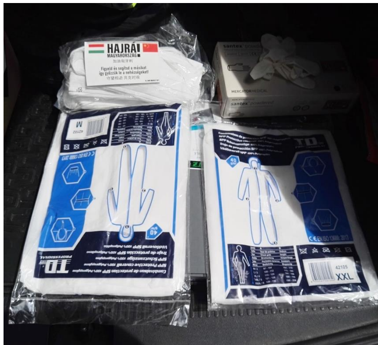
6. számú kép: Szolgálati gépjármű csomagterében elhelyezett védőfelszerelés