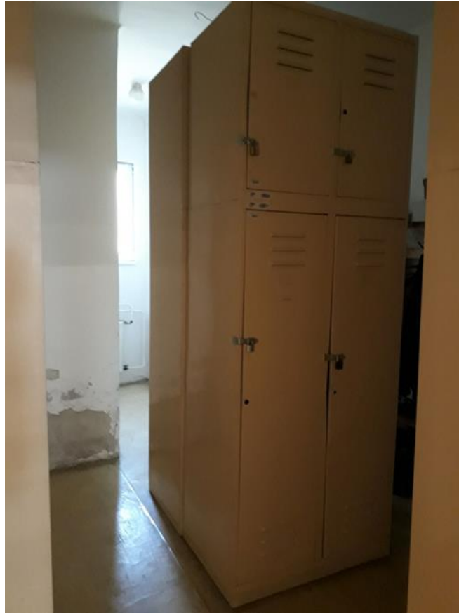
5. számú kép: Öltöző helyiség