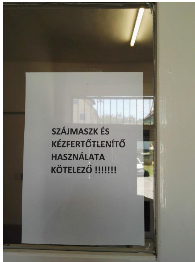
1. számú kép: Figyelmeztető felirat a rendőrőrs bejáratánál