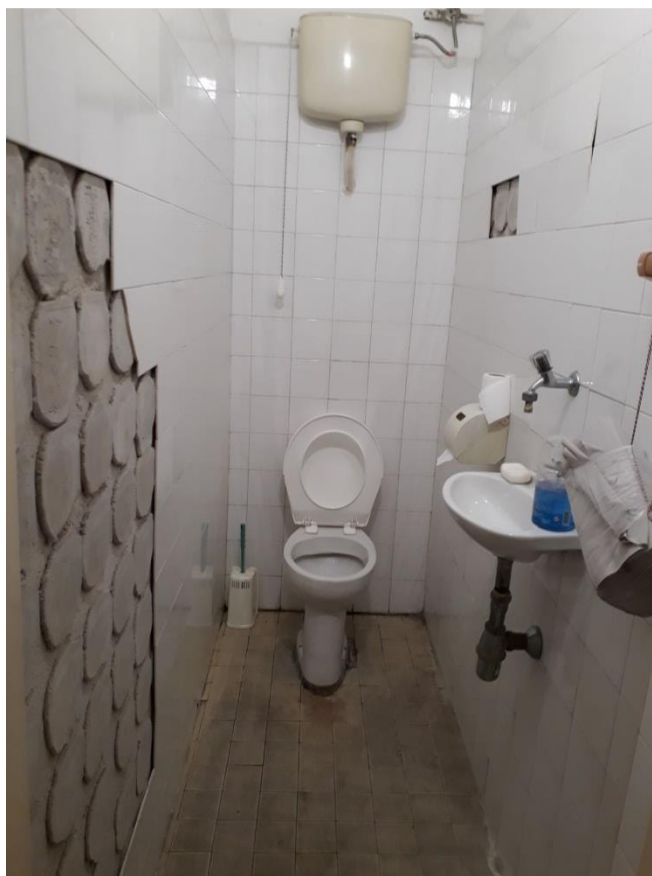
4. számú kép: Fogvatartottak mellékhelyisége