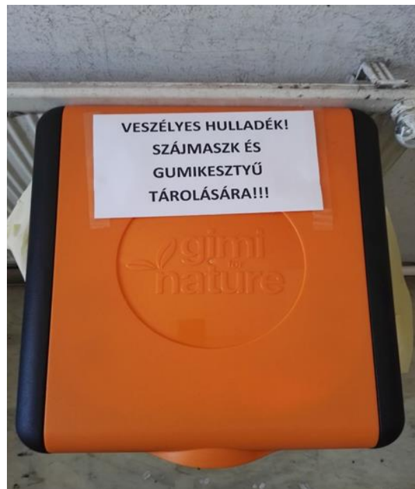
2. számú kép: Veszélyes hulladék tárolása szolgáló fóliazsák